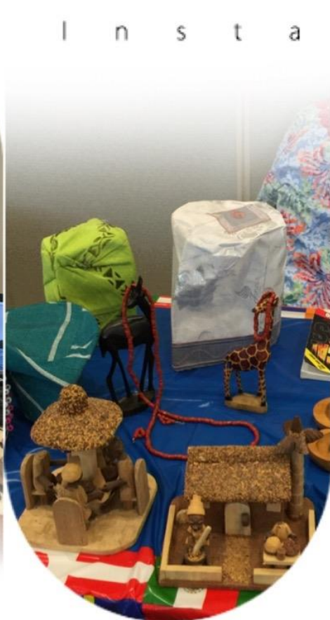
I n s t a M a