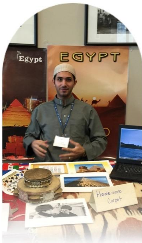
a M a g